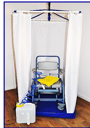
Kamerdouche mobiel kan overal opgezet worden

Wij komen graag bij u een demonstratie geven!