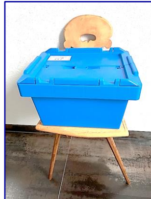
Beddouche met vaste aansluiting op douchekraan. complet in koffer box