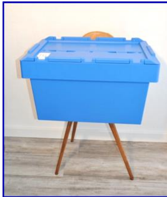
Beddouche mobiel complet in koffer box 8,5 kg