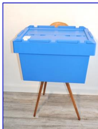
Beddouche mobiel compl. in koffer box 8,5 kg

Wij komen graag bij u een demonstratie geven!