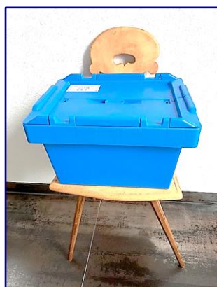
Beddouche met vaste aansluiting op douchekraan compl. in koffer box 5 kg